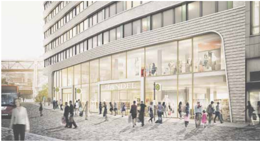
© Entwurf: SchütteSchwarz Architekten | Visualisierung: rendertaxi

Durch architektonische Qualität und entsprechende Vermarktung lässt sich gesellschaftlicher Mehrwert schaffen