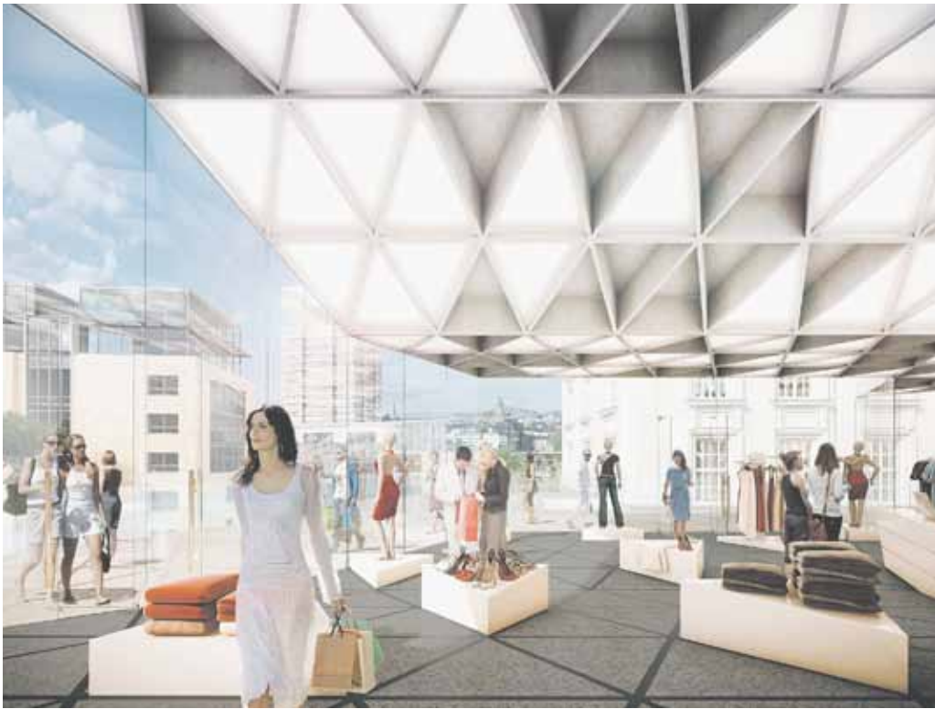
Innenperspektive der Brücke

Im Zuge der Umgestaltung des Döppersbergs wird auch die ehemalige Bundesbahndirektion in eine neue Epoche überführt werden. Das im Jahr 1875 erbaute Gebäude prägt seit rund 140 Jahren mit seiner klassizistischen Architektur das Wuppertaler Stadtbild. Markante Charakteristika sind die Freitreppe, die links und rechts von zwei bergischen Löwen geziert wird, und das eindrucksvolle Säulenportal. Von 1914 bis 1916 wurde der imposante Bau um einen Westtrakt erweitert. Schwere Zerstörungen im zweiten Weltkrieg konnten der Immobilie zum Glück auf Dauer nichts anhaben. Sie wurde nach dem Wiederaufbau bis zum Ende des Jahres 1974 weiter von der Bundesbahndirektion genutzt. Danach begann allerdings eine