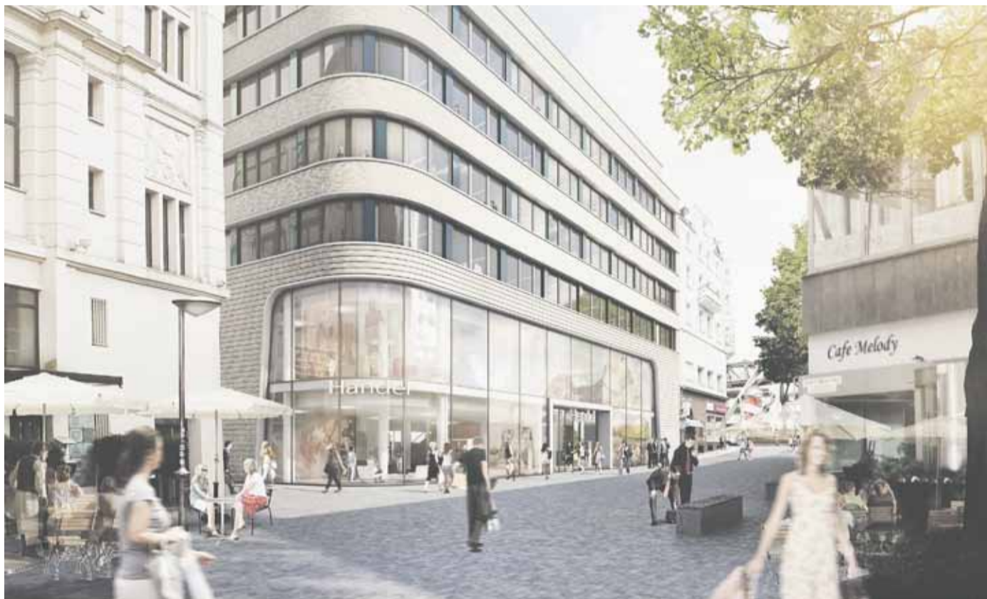
Geschäftshaus Wall 36 / Ansicht Wirmhof

sem Bereich steht charakteristisch für die gesamte Stadt und strahlt als Leuchtturmprojekt weit über die Grenzen Wuppertals hinaus. Wir gehen davon aus, dass dies einen positiven Effekt für das gesamte Image der Stadt Wuppertal haben wird“, so Sven Bayer. Zusammengefasst waren die positiven Entwicklungen in der Stadt, die gute Lage des Standortes und die hervorragende Zusammenarbeit mit der Wirtschaftsförderung der Stadt Wuppertal und der Stadt selbst ausschlaggebend dafür, dass die Landmarken AG in Wuppertal am Wall 36 investiert hat – und es ist nicht auszuschließen, dass weitere Projekte folgen.