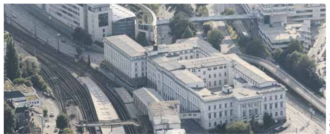
Postgebäude und Bundesbahndirektion bieten die Grundlage für die FOC Planung

Ein neues FOC soll demnächst das Bahnhofsumfeld um eine weitere Einkaufsmöglichkeit ergänzen und zur Attraktivität des Standortes beitragen.