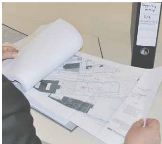
15 Stunden dauerte die Verlesung des Vertrags

nach Vertragsunterzeichnung erleichtert waren. Mindestens ein Vertreter wog mangels Bewegung und Fastfood nach der Unterschrift sicher ein paar Pfund mehr.