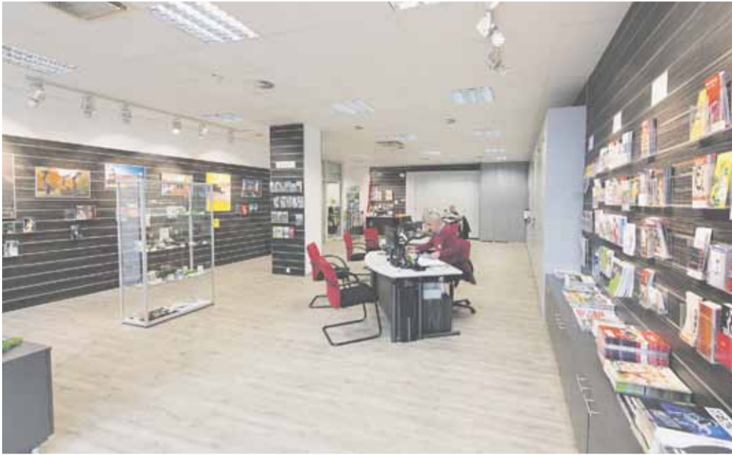
Die Räumlichkeiten der Tourist-Info im City Center

Tourist-Info bietet jede Menge Wuppertal.