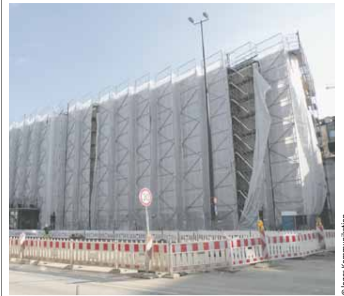
Das Berufskolleg Elberfeld während der Sanierung: fast schon ein Christo-Kunstwerk